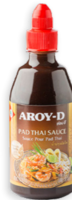
Salsa Pad Thai Aroy-D Ref. 0223 - 12 x 420ml