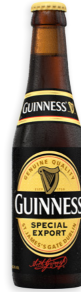
John Martin 8° Ref. 0005 - 24 x 330ml