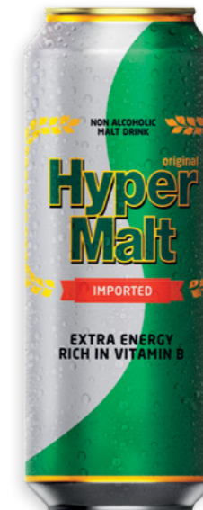
Hyper Malt llaua Ref. 3437 - 24 x 500ml