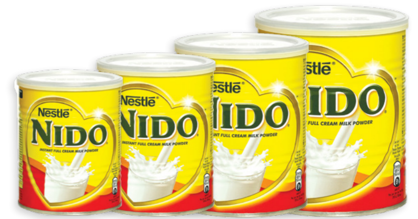
Nestlé Nido Ref. 0128 - 24 x 400g