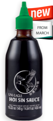
Salsa Hoi Sin Sauce Uni-Eagle Ref. 3720 - 12 x 430ml