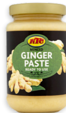
Pasta de Gíngebre KTC Ref. 2663 - 12 x 210g