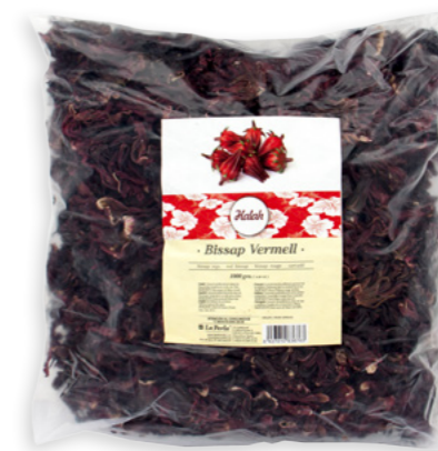
Bissap vermell Halah Ref. 0101 - 1 x 1Kg