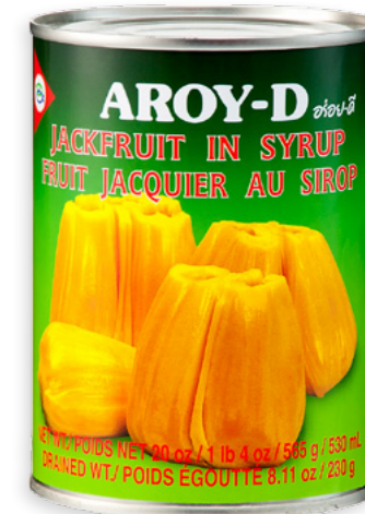
Jackfruit en almívar Ref. 0235 - 24 x 565g