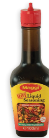
Salsa Maggi Hot Ref. 0161 - 12 x 100ml