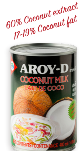
Llet de coco Ref. 0196 - 24 x 400ml