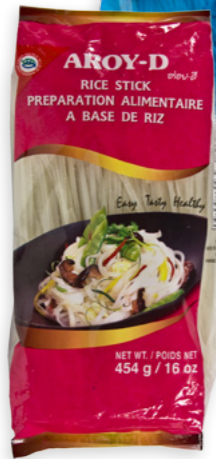
Tallarines 3mm Aroy-D Ref. 0281 - 30 x 454g Ref. 3378 - 2 x 5kg