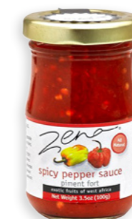
Salsa picant Zena Ref. 1417 - 24 x 100g Ref. 1377 - 12 x 370g