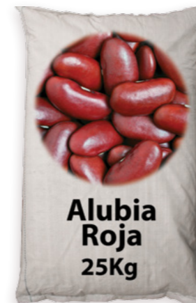
Mongeta Vermella Ref. 3780 - 1 x 25Kg new