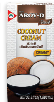
Crema de coco Ref. 0195 - 12 x 1l