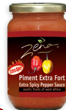
Salsa extra picant Zena Ref. 3513 - 12 x 270g