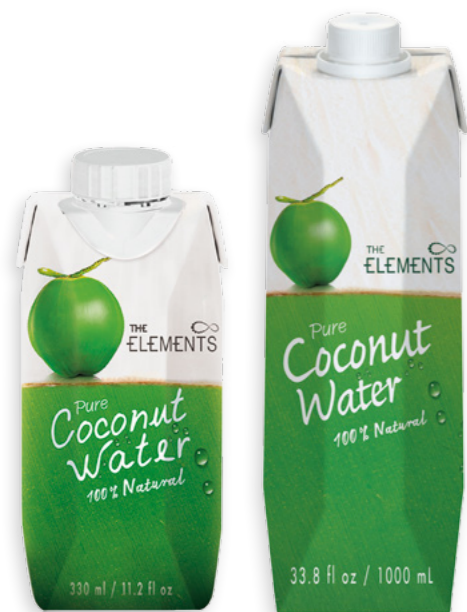
Aigua de Coco Ref. 1985 - 12 x 330ml / Ref. 2241 - 12 x 1l