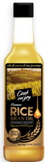
Oli d'arròs Ref. 3377 - 12 x 500ml