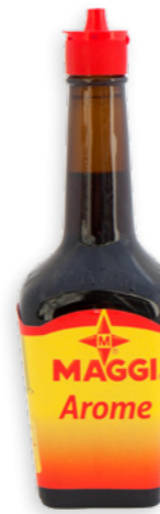
Salsa Maggi Arome Ref. 0159 - 20 x 200ml Ref. 0160 - 6 x 960ml