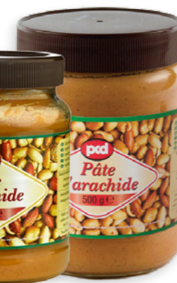
Pasta de cacauet PCD idiomes Ref. 0170 - 12 x 500g Ref. 2322 - 12 x 350g