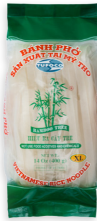
Tallarines 10mm Bamboo Tree Ref. 3737 - 30 x 400g