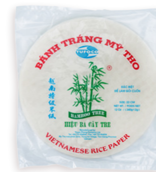
Paper d'arròs 22cm Ref. 1084 - 44 x 340g new