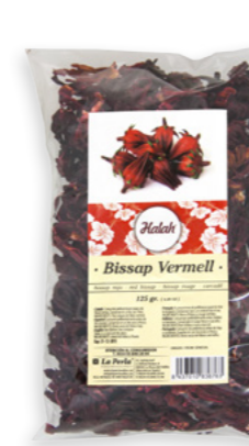
Bissap vermell Halah Ref. 1438 - 15 x 125g