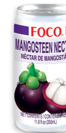
Mangostà Ref. 0061 - 24 x 350ml