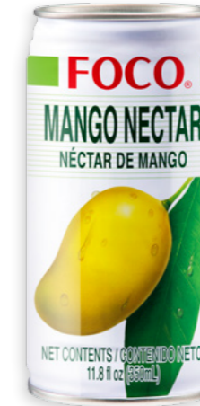
Mango Ref. 0060 - 24 x 350ml