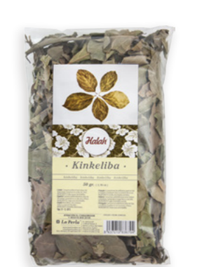
Kinkeliba Halah Ref. 1439 - 15 x 50g