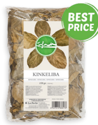
Kinkeliba Safna Ref. 1969 - 10 x 150g