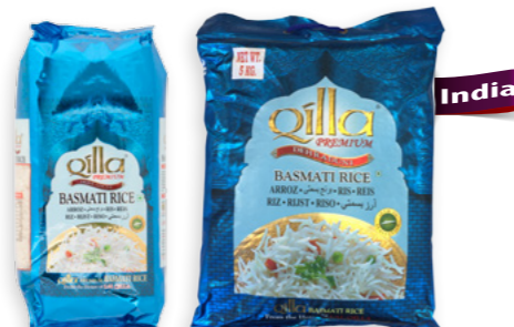
Basmati Qilla Premium Ref. 1847 - 20 × 1Kg / Ref. 2223 - 4 × 5Kg