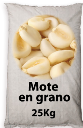
Mote en gra Ref. 3778 - 1 x 25Kg new