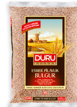
Bulgur Gros Fosc Duru 1kg Ref. 2398 - 12 x 1kg