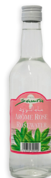
Aigua de Roses Ref.3319 - 12 x 500ml