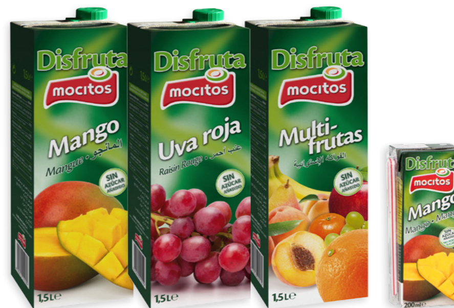
Mango Ref. 0070 - 8 x 1,5l Raïm Ref. 0081 - 8 x 1,5l Multifruites Ref. 0085 - 8 x 1,5l Mango Ref. 1911 - 24 x 200ml

Sucs de fruita amb sucres afegits · Zumos de fruta con azúcares añadidos · Fruit juices with added sugar · Jus de fruits avec sucre ajouté