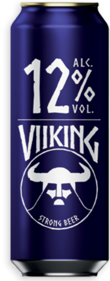
Viking 12° Ref. 3283 - 24 x 500ml

MALTA I GINGEBRE MALTA Y JENGIBRE MALT AND GINGER MALTE ET GINGEMBRE