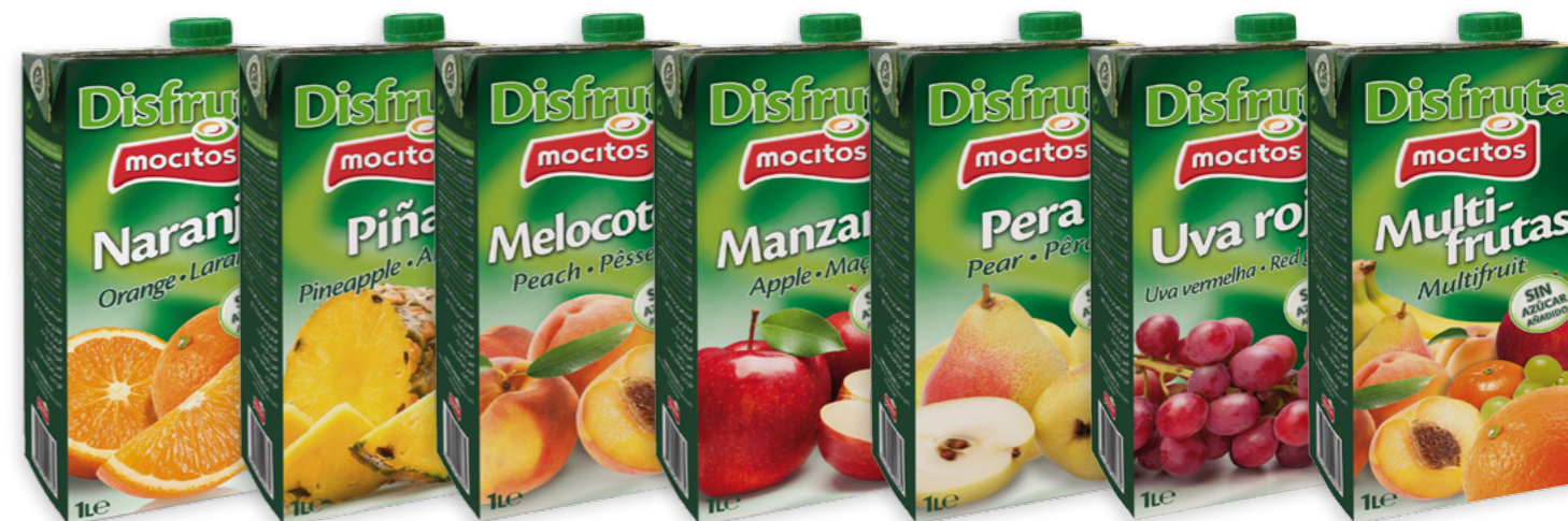
Taronja Ref. 0084 - 12 x 1l Pinya Ref. 0075 - 12 x 1l Préssec Ref. 0080 - 12 x 1l Poma Ref. 0078 - 12 x 1l Pera Ref. 0073 - 12 x 1l Raïm vermell Ref. 0082 - 12 x 1l Multifruites Ref. 2008 - 12 x 1l