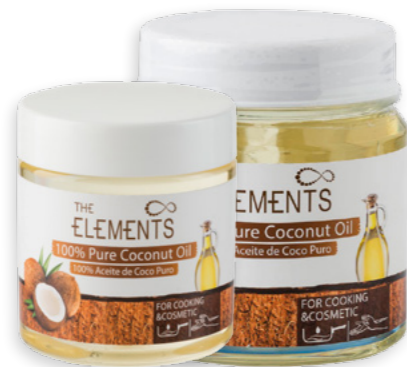
Oli de coco pur Ref. 2297 - 12 x 250ml / Ref. 2466 - 6 x 500ml