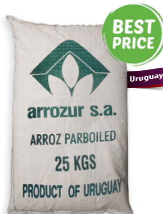
Arros vaporitzat Arrozur Ref. 0304 - 1 × 25Kg