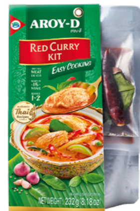
Ready to cook Kit Curri Vermell Ref.3690 - 6 x 232g new