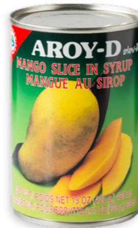
Mango slice en almívar Ref. 0239 - 24 x 425g