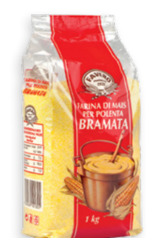
Bramata Ref. 3375 - 10 x 1Kg

0351 & 2240. Farina de iuca · Harina de yucca · Cassava flour · Farine de yucca 1617. Midó de iuca dolç · Almidón de yuca dulce · Sweet cassava starch · Amidon de manioc doux 0368 & 0369. Puré de patata · Puré de patata · Mashed potatoes · Purée de pomme de terre 0366 & 0367. Fècula de patata · Fécula de patata · Potato starch · Fécule de pomme de terre 3373. Farina de blat de moro per polenta blanca · Harina de maiz para polenta blanca · White corn flour for polenta · Farine de maïs blanche pour polenta 3374. Farina de blat de moro per polenta groga · Harina de maiz para polenta amarilla · Yellow corn flour for polenta · Farine de maïs jaune pour polenta 3375. Farina de blat de moro per polenta groga gruixuda · Harina de maiz para polenta amarilla gruesa · Yellow corn flour for polenta coarse · Farine de maïs jaune grossier pour polenta