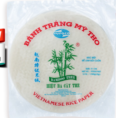
Paper d'arròs 31cm Ref. 3733 - 44 x 340g new