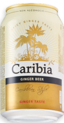
Ginger beer Ref. 0026 - 24 x 330ml

REFRESCS REFRESCOS SOFT DRINKS RAFRAÏCHISSANTES