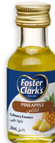
Essència de pinya Ref.0120 - 12 x 28ml