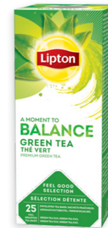
Te verd Ref. 2162 - 6 x 25 bags

2249 & 1493. Te negre · Té negro · Black tea · Thé noir 2161. Te amb fruits del bosc · Té con frutas del bosque · Forest fruits tea · Thé fruits rouges 1915. Te negre "Earl Grey" · Té negro "Earl Grey" · "Earl grey" black tea · Thé noir "Earl grey" 1914. Te negre "English Breakfast" · Té negro "English Breakfast" · "English Breakfast" black tea · Thé noir "English breakfast" 2162. Te verd · Té verde · Green tea · Thé vert 1967 & 1438 & 0101. Hibisc vermell (bissap) · Hibisco rojo (bissap) · Red Bissap · Bissap rouge (Carcadé) 1968 & 1437 & 0099. Hibisc blanc (bissap) · Hibisco blanco (bissap) · White bissap · Bissap blanc (Carcadé) 1969 & 1439. Fulles de kinkeliba · Hojas de kinkeliba · Kinkeliba leaves · Feuilles de kinkeliba