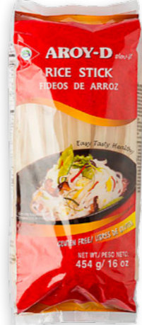
Tallarines 10mm Aroy-D Ref. 2827 - 30 x 454g