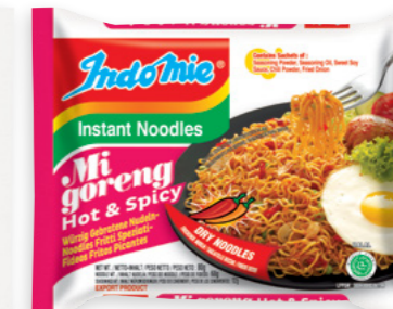
Noodles "Mi goreng spicy" Ref. 0274 - 40 x 80g