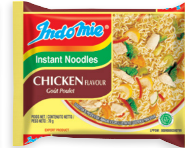
Noodles Àfrica Ref. 1309 - 40 x 70g