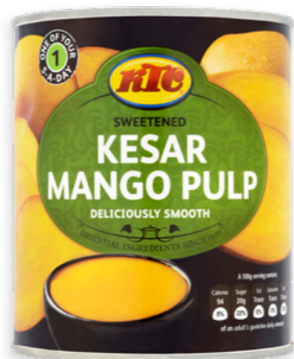
Polpa de Mango Kesar Ref. 1690 - 6 x 850g

2299. Oli de coco verge · Aceite de coco virgen · Virgin Coconut oil · Huile de coco vierge 2297 & 2466. Oli de coco pur · Aceite de coco puro · Pure Coconut oil · Huile de coco pur 3377. Oli d'arròs · Aceite de arroz · Rice Oil · Huile de riz 2918. Oli de llavors de sèsam torrat · Aceite de semillas de sésamo tostado · Toasted Sesam Seed Oil · Huile de graines de sésame grillé 2230. Oli de llavors de sèsam cru · Aceite de semillas de sésamo crudo · Raw Pure Sesam Seed Oil · Huile de graines de sésame cru 2231 & 2830. Oli de mostassa · Aceite de mostaza · Pure Mustard Oil · Huile de moutarde 2252. Oli de llavors de Llinosa · Aceite de linazada · Linseed Oil · Huile de lin 2829 & 2232. Oli d'ametlles · Aceite de almendras · Pure Almond Oil · Huile de amandes 3667 & 1680. Chutney o mermelada de Mango dolç · Chutney o mermelada de mango dulce · Sweet Mango chutney or Mango jam · Chutney ou confiture de mangue douce 1690. Polpa de Mango Kesar · Pulpa de Mango Kesar · Kesar Mango Pulp · Pâte de mangue Kesar 2844. Tamarinde pur premsat i assecat amb llavor · Tamarindo puro prensado y secado con semilla · Pressed and dried pure tamarinde with seed · Tamarinde pur pressé et séché avec noyaux