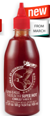
Salsa Xili Sriracha Super Hot Uni-Eagle Ref. 3719 - 12 x 440ml