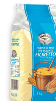
Fioretto Grogà Ref. 3374 - 10 x 1Kg