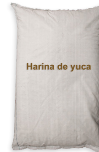
Farina de iuca Ref. 2240 - 1 x 25kg