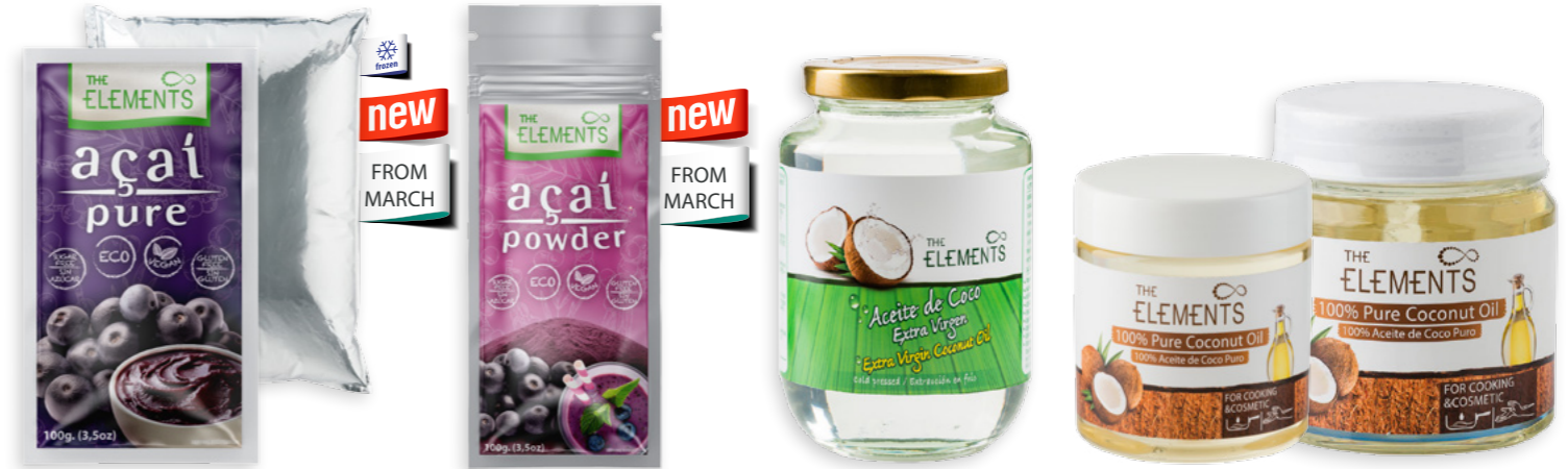
Purè d'Açaí Congelat Ref. 3817 - 60 x 100g / Ref. 3822 - 10 x 1kg

Productos The Elements · The Elements Food · The Elements produits