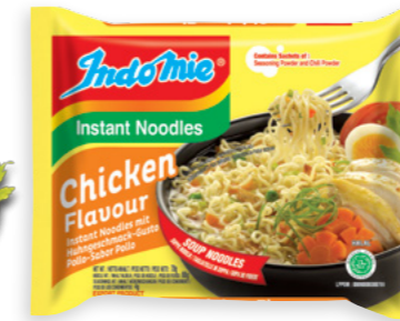
Noodles Pollastre Ref. 0275 - 40 x 70g