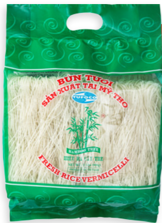
Fideos d'arròs Vermicelli Bamboo Tree Ref. 3738 - 30 x 400g