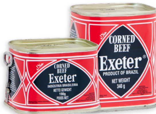
Exeter de vedella Ref. 0179 - 24 x 198g Ref. 0180 - 24 x 340g