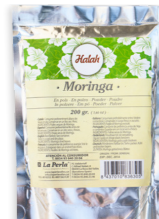
Moringa en pols Ref. 1986 - 10 x 200g