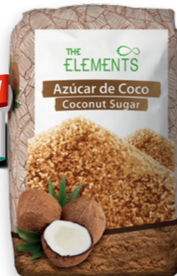
Sucre de Coco Ref. 3752 - 12 x 300g / Ref. 2327 - 12 x 1kg / Ref. 2255 - 1 x 20kg