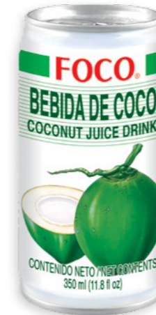
Coco Ref. 0055 - 24 x 350ml