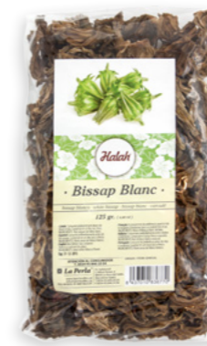
Bissap blanc Halah Ref. 1437 - 15 x 125g