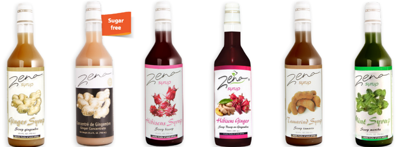
Xarop de Gingebre Ref.0094 - 12 x 750ml Concentrat de Gingebre Ref.1887 - 12 x 750ml Xarop de Bissap Ref.0093 - 12 x 750ml Xarop de Bissap i Gingebre Ref.3270 - 12 x 750ml Xarop de Tamarinde Ref.0096 - 12 x 750ml Xarop de Menta Ref. 2082 - 12 x 750ml

Jarabes de frutas e Infusiones · Syrups and Infusions · Sirops et Infusions