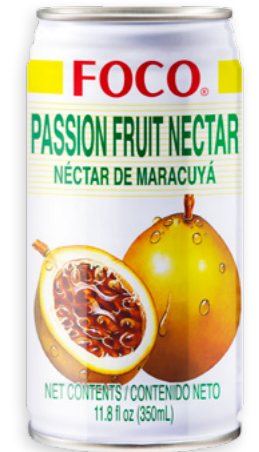
Fruita de la passió Ref. 0062 - 24 x 350ml