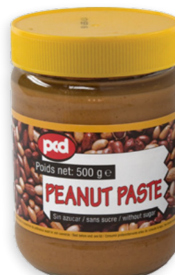
Pasta de cacauet sense sucre PCD Ref. 0171 - 12 x 500g