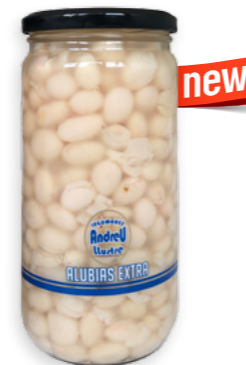
Mongetes Seques Cuits Extra Ref. 3783 - 6 x 720g new

3778. Blat de Moro Mote · Maíz Mote · Mote Yellow Corn · Maïs Mote 3780. Mongeta vermella · Alubia Roja · Red Beans · Haricot Rouge 3853. Mongeta Seda · Frijol seda · Seda beans · Haricot seda 3779. Mongeta negra · Alubia negra · Black Beans · Haricot noir 3818. Blat de Moro Cancha per torrar · Maíz Cancha para tostar · Yellow Corn Cancha · Maíz Cancha 3819. Arvejas · Arvejas · Arvejas · Arvejas 3330 & 3331. Farina de cigró · Harina de garbanzo · Chickpea flour · Farine de pois chiche 3782. Cigrons cuits · Garbanzos Cocidos · Cooked chick peas · Pois chiches cuits 3781. Llenties cuits · Lentejas Cocidas · Cooked lentils · Lentilles cuits 3783. Mongetes Seques Cuits · Alubias Cocidas · Cooked beans · Haricots cuits