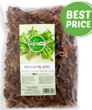
Bissap blanc Safna Ref. 1968 - 10 x 250g