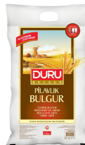
Bulgur Gros Clar Duru Ref. 2723 - 1 x 25kg