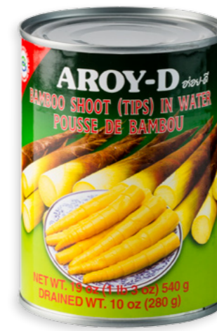
Bambú in brine Ref. 0230 - 24 x 540g