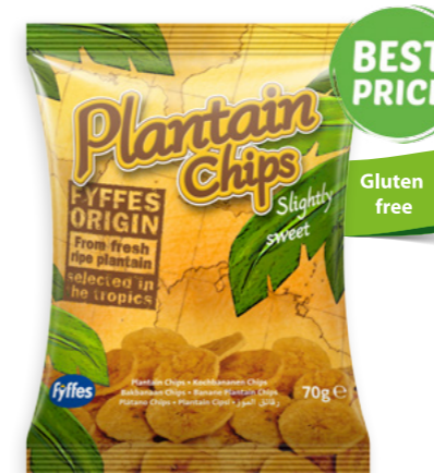
Xips de banana Fyffes dolces Ref. 1777 - 24 x 70g