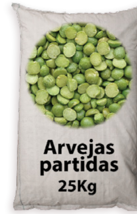
Arvejas Ref. 3819 - 1 x 25Kg new