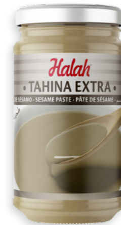
Tahina Halah Ref. 1376 - 6 x 350g