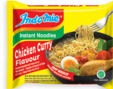
Noodles Pollastre al Curri Ref. 2394 - 40 x 80g