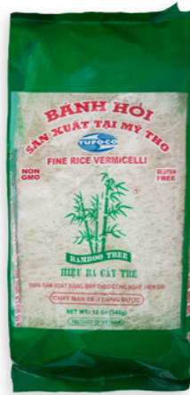
Fideos fins d'arròs Vermicelli Bamboo Tree Ref. 3739 - 40 x 340g