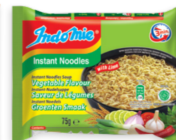
Noodles Vegetals Ref. 0279 - 40 x 80g