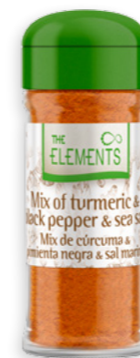
Mix de Cúrcuma, Pebre i Sal Marina Ref. 3410 - 6 x 50g