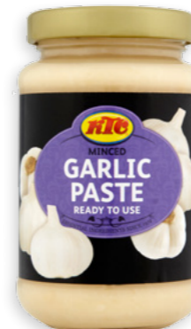
Pasta d'All KTC Ref. 2665 - 12 x 210g