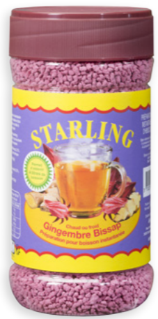
Te amb Gingebre i Bissap Ref. 3210 - 12 x 400g