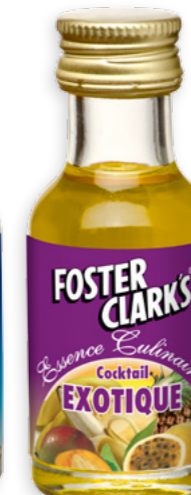
Essència exòtica Ref.2134 - 12 x 28ml