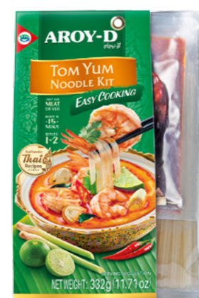
Ready to cook Noodle Kit Tom Yum Ref.3692 - 6 x 332g new