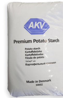
Fècula de patata Ref. 0367 - 1 x 6Kg / Ref. 0366 - 1 x 25Kg