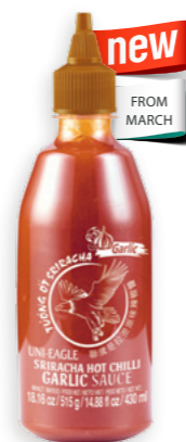
Salsa Xili Sriracha Garlic Uni-Eagle Ref. 3753 - 12 x 435ml