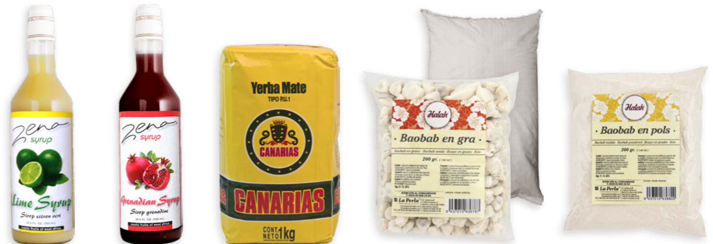
Xarop de Lima Ref.2084 - 12 x 750ml Xarop de Granadina Ref.2085 - 12 x 750ml Yerba Mate Canarias Ref.0110 - 20 x 1Kg Baobab en gra Halah Ref. 1435 - 15 x 200g Baobab en pols Halah Ref. 1888 - 1 x 20kg