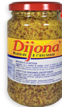
Mostassa Dijona a l'Antiga Ref. 1919 - 12 x 370g