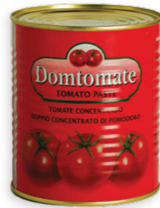
Domtomate 800g Ref. 0156 - 12 x 800g