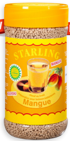
Te amb Mango Ref. 3682 - 12 x 400g