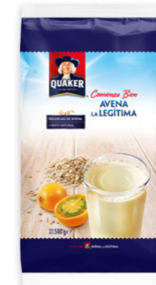
Avena La Legítima Quaker Ref. 3159 - 16 x 500g