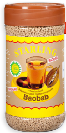
Te amb Baobab Ref. 3683 - 12 x 400g