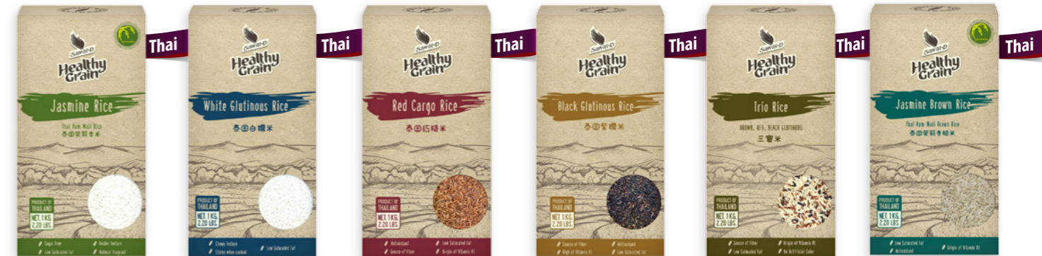
Arros perfumat Ref. 3328 - 12 × 1Kg