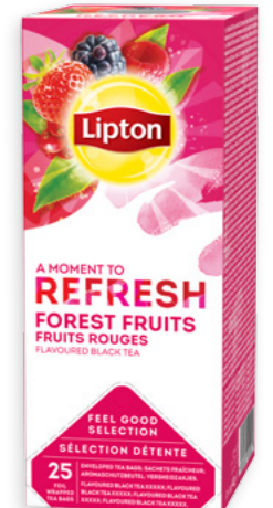
Te amb fruits del bosc Ref. 2161 - 6 x 25 bags