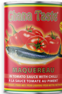
Verat amb tomàquet i xili Ghana Taste Ref. 0186 - 24 x 425g