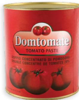
Domtomate 2800g Ref. 0153 - 3 x 2800g