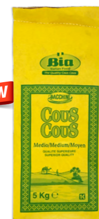
Cuscús Mitjà Bia Ref. 3727 - 1 x 5kg