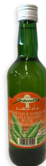
Aigua de flor de taronger Ref.3321 - 12 x 500ml

0121. Essència de plàtan · Esencia de plátano · Banana essence · Essence de banane 0120. Essència de pinya · Esencia de piña · Pineapple essence · Essence d'ananas 0119. Essència de maduixa · Esencia de fresa · Strawberry essence · Essence de fraise 0122. Essència de vainilla · Esencia de vainilla · Vanilla essence · Essence de vanille 1483. Essència d'ametlla · Esencia de almendra · Almond essence · Essence de amande 1484. Essència de coco · Esencia de coco · Coconut essence · Essence de noix de coco 2134. Essència de fruits exòtics · Esencia de frutas exóticas · Exotic fruit essence · Essence de fruits exotiques 2133. Essència de llimona · Esencia de limón · Lemon essence · Essence de citron 2132. Essència de menta · Esencia de menta · Mint essence · Essences de menthe 2007. Essència de rosa · Esencia de rosa · Rose essence · Essence de rose 3319. Aigua amb aroma de rosa · Agua con aroma de rosa · Rosewater · Eau d'arôme de rose 3321. Aigua amb aroma de taronja · Agua con aroma de naranja · Orange blossom water · Eau d'arôme d'orange