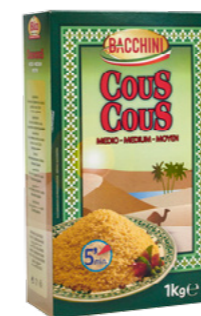
Cuscús Mitjà Bacchini Ref. 3729 - 10 x 1kg