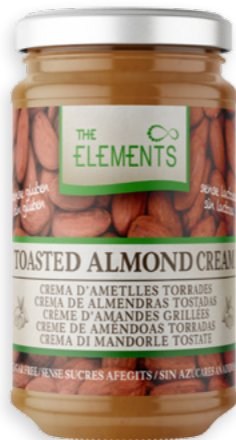
Crema d'Ametlles Ref. 3138 - 6 x 425g