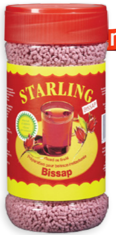
Te amb Bissap Ref. 3679 - 12 x 400g