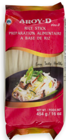
Tallarines 5mm Aroy-D Ref. 0282 - 30 x 454g