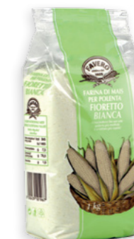
Fioretto Blanca Ref. 3373 - 10 x 1Kg