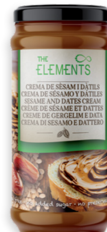
Crema de Sèsam i Dàtils Ref. 3289 - 6 x 230g