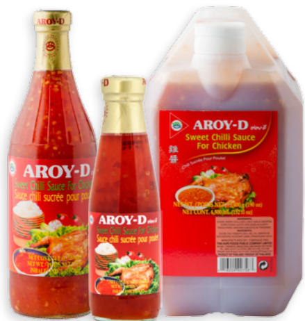
Salsa Xili dolça per pollastre Aroy-D Ref. 2211 - 3 x 4500ml Ref. 2320 - 12 x 720ml Ref. 0215 - 24 x 200ml