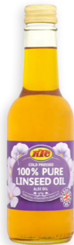
Oli de Llinosa Ref. 2252 - 12 x 250ml