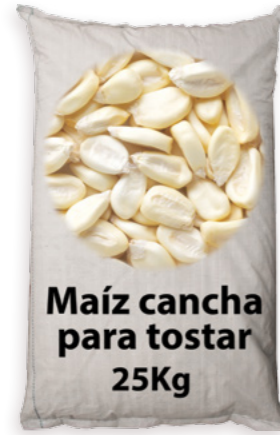
Maíz de Tostar Ref. 3818 - 1 x 25Kg new