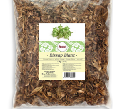
Bissap blanc Halah Ref. 0099 - 1 x 1Kg