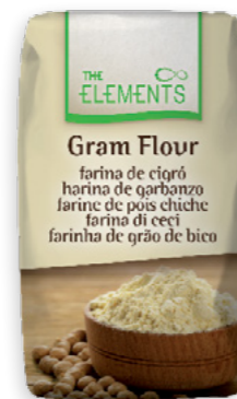
Farina de cigró The Elements Ref. 3330 - 12 x 1Kg Ref. 3331 - 1 x 20Kg