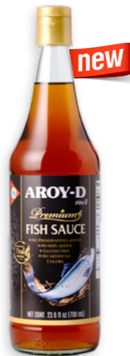
Salsa de peix Premium Aroy-D Ref. 3718 - 12 x 700ml