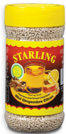
Te amb Gingebre, mel i llimona Ref. 2623 - 12 x 400g