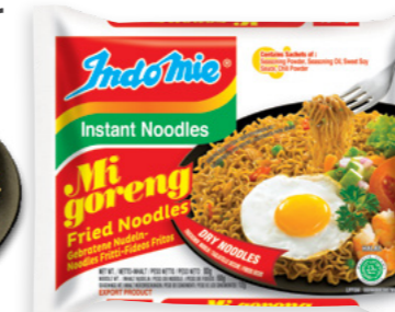
Noodles "Mi Goreng" Ref. 0273 - 40 x 80g