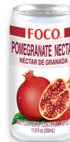
Magrana Ref. 0065 - 24 x 350ml

0055. Coco · Coco · Coconut · Coco 0067. Tamarinde · Tamarindo · Tamarind · Tamarin 0060. Mango · Mango · Mango · Mangue 0063. Mango i fruita de la passió · Mango y maracuyá · Mango and passion fruit · Mangue et fruit de la passion 0062. Fruita de la passió · Fruta de la pasión · Passion fruit · Fruit de la passion 0058. Guaiaba · Guayaba · Guava · Goyave 0057. Guanàbana · Guanábana · Soursop · Corossol 0066. Coco torrat · Coco tostado · Roasted coconut · Coco rôtie 0054. Canya de sucre · Caña de azúcar · Sugar cane · Canne à sucre 0059. Litxi · Litchi · Lychee · Litchi 0065. Magrana · Granada · Pomegranate · Grenade 0061. Mangostà · Mangostán · Mangosteem · Mangoustan 0050. Àloe Vera amb mel · Àloe Vera con miel · Aloe Vera with honey · Aloe Vera avec du miel