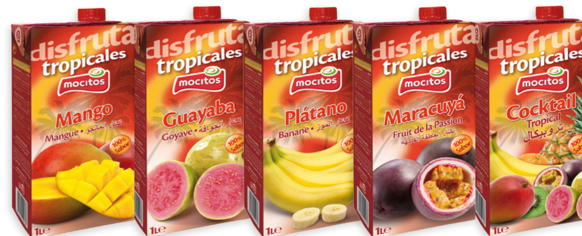
Mango Ref. 0071 - 12 x 1l Guaiaba Ref. 0069 - 12 x 1l Plátan Ref. 0077 - 12 x 1l Maracuià Ref. 0072 - 12 x 1l Cocktail Ref. 0086 - 12 x 1l