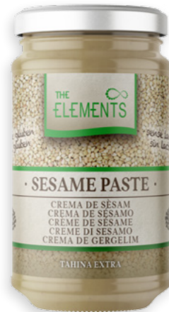
Tahina Ref. 2365 - 6 x 350g