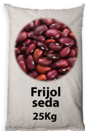
Mongeta Seda Ref. 3853 - 1 x 25Kg new