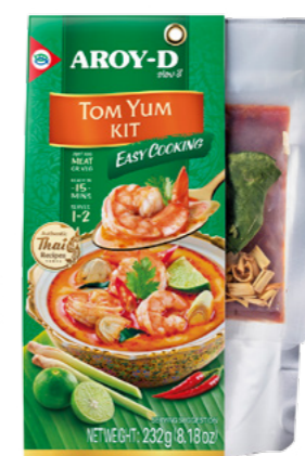
Ready to cook Kit Tom Yum Ref.3691 - 6 x 232g new