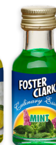
Essència de menta Ref.2132 - 12 x 28ml