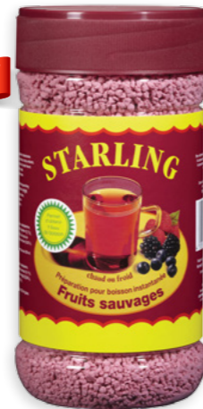
Te amb Fruits del Bosc Ref. 3681 - 12 x 400g