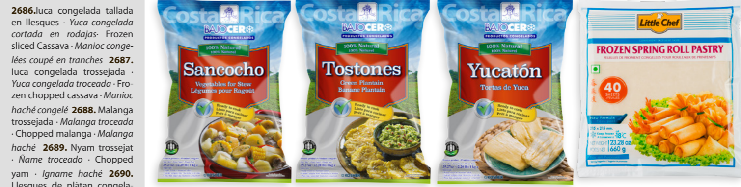
Sancocho Ref. 2691 - 12 x 1kg Tostones Ref. 3256 - 10 x 1kg Yucatón Ref. 3432 - 10 x 1kg Spring Roll Pastry Ref. 2704 - 20 x 40u x 8.5g x 660g