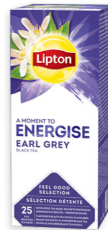
Te negre Earl Grey Ref. 1915 - 6 x 25 bags