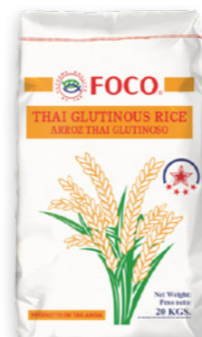
Arros Glutinós FOCO Ref. 3326 - 1 × 20Kg