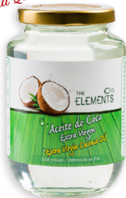
Oli de coco verge Ref. 2299 - 12 x 450ml