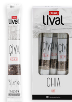
Xia DURU Lival Ref. 3264 - 10 x 80g