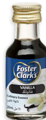
Essència de vainilla Ref.0122 - 12 x 28ml