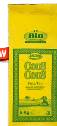
Cuscús Fi Bia Ref. 3728 - 1 x 5kg