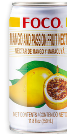
Mango i F. Passió Ref. 0063 - 24 x 350ml