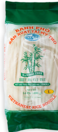
Tallarines 5mm Bamboo Tree Ref. 3736 - 30 x 400g