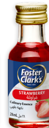
Essència de maduixa Ref.0119 - 12 x 28ml