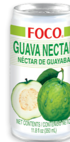
Guava Ref. 0058 - 24 x 350ml