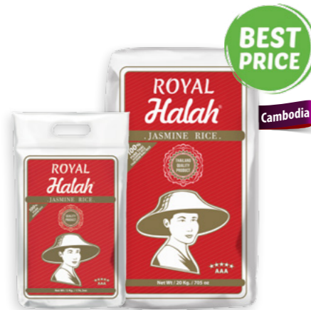
Royal Halah Ref. 1891 - 5 × 5Kg Ref. 1792 - 1 × 20Kg