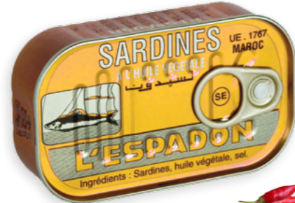
Sardines picants Espadon Ref. 0193 - 50 x 125g