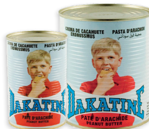
Pasta de cacauet Dakatine Ref. 2346 - 12 x 425g Ref. 2347 - 6 x 850g