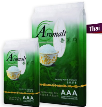
Aromali Ref. 0288 - 4 × 5Kg Ref. 0287 - 1 × 20Kg