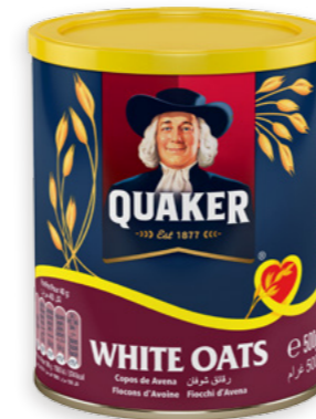
Quaker White Oats Ref. 0116 - 24 x 500g