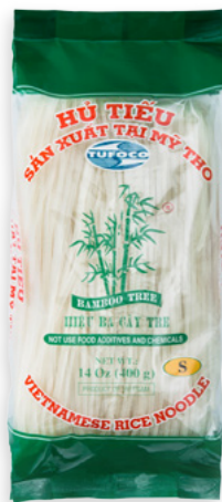
Tallarines 1mm Bamboo Tree Ref. 3734 - 30 x 400g