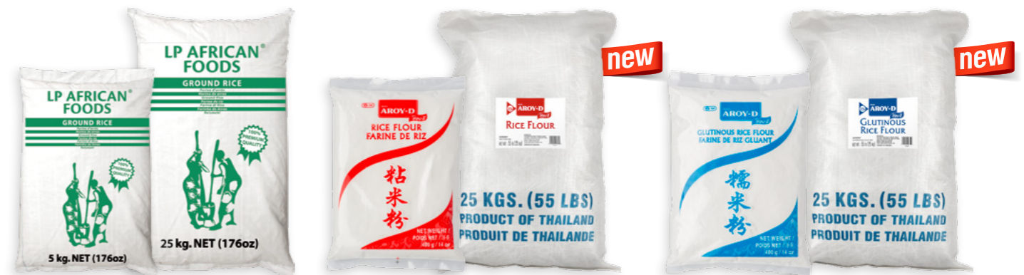
Farina d'arros LP African Foods Ref. 0313 - 1 × 5Kg Ref. 0312 - 1 × 25Kg