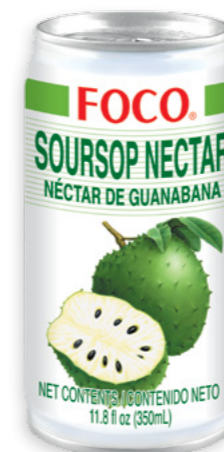
Guanàbana Ref. 0057 - 24 x 350ml