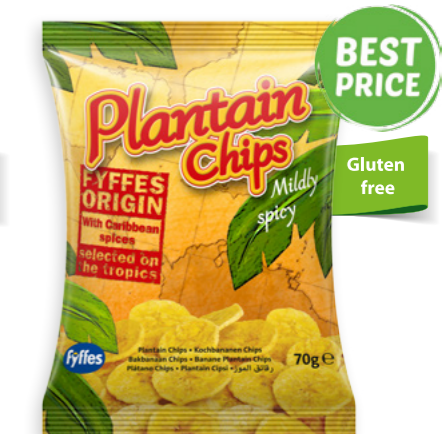
Xips de banana Fyffes picants Ref. 1779 - 24 x 70g

0116. Civada blanca de cocció ràpida · Avena blanca de cocció rápida · Quick cooking white oats · Avoine blanche de cuisson rapide 3159. Flocs d'avena integral · Copos de Avena Integral · Whole Grain Oat Flakes · Flocons d'avoine à grains entiers 0126 & 0127 & 0128 & 0129. Llet sencera en pols · Leche entera en polvo · Instant full cream milk powder · Lait entier instantané en poudre 0124. Llet evaporada sense sucre · Leche evaporada sin azúcar · Evaporated unsweetened milk · Lait évaporé sans sucre 3290. Batut de garrofa, maca i sucre de coco · Batido de algarroba, azúcar de coco y maca · Carob, maca and coconut sugar shake · Shake au caroube, maca et sucre de coco 3824. Cacau en pols · Cacao en polvo · Cocoa powder · Poudre de cacao 1777. Xips de plátano dolces · Chips de plátano dulces · Natural sweet plantain chips · Chips de banana douce 1778. Xips de plátano salades · Chips de plátano saladas · Salted plantain chips · Chips de banana salées 1779. Xips de plátano picants · Chips de plátano picantes · Spicy plantain chips · Chips de banana épicé