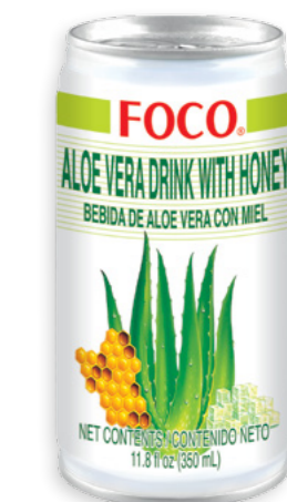
Àloe Vera amb Mel Ref. 0050 - 24 x 350ml