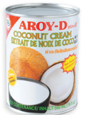
Crema de coco Ref. 0194 - 24 x 560ml