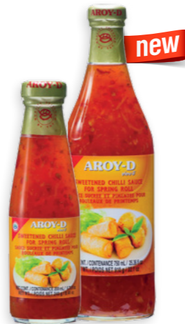
Salsa Xili dolça per rotllets Aroy-D Ref. 2296 - 12 x 750ml Ref. 2295 - 24 x 200ml