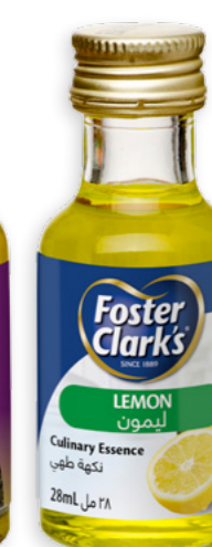
Essència de llimona Ref. 2133 - 12 x 28ml