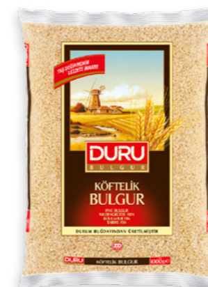
Bulgur Fi Clar Duru 1kg Ref. 2399 - 12 x 1kg