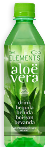
Beguda d'Àloe Vera Ref. 2648 - 20 x 500ml / Ref. 2649 - 12 x 1,5l