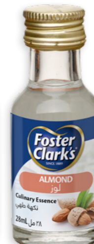
Essència d'ametlla Ref.1483 - 12 x 28ml