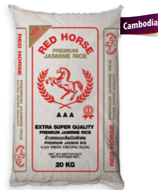
Red Horse Ref. 0286 - 1 × 20Kg