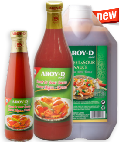
Salsa agredolça Aroy-D Ref. 3694 - 4 x 4690ml Ref. 0210 - 12 x 720ml Ref. 0209 - 24 x 190ml