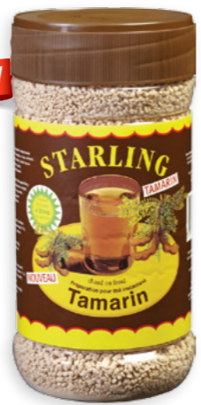
Te amb Tamarinde Ref. 2622 - 12 x 400g