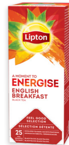
Te negre English Breakfast Ref. 1914 - 6 x 25 bags