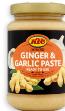
Pasta de Gíngebre i All KTC Ref. 2664 - 12 x 210g