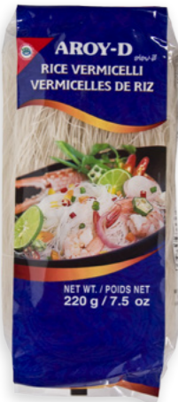
Fideos fins d'arròs Vermicelli Aroy-D Ref. 0267 - 40 x 220g