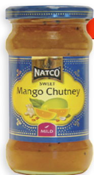
Chutney de Mango dolç Ref. 3667 - 6 x 340g