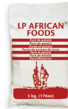
Puré de patata LP African foods Ref. 0369 - 1 x 5Kg / Ref. 0368 - 1 x 10Kg