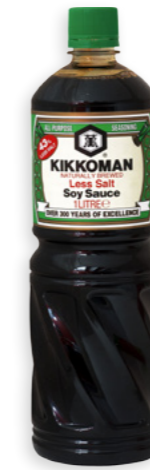
Salsa de soja baixa en sal Kikkoman 1l Ref. 1177 - 6 x 1l