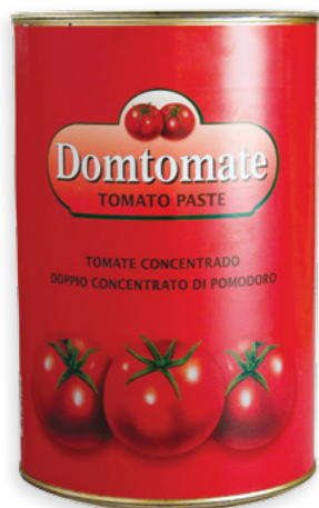
Domtomate 4540g Ref. 0155 - 3 x 4540g