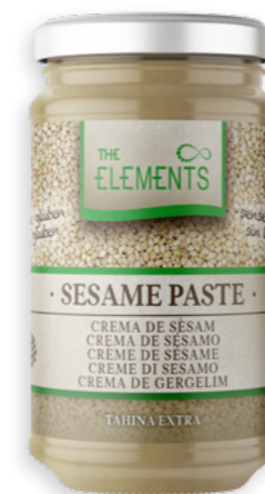
Tahina Ref. 2365 - 6 x 350g