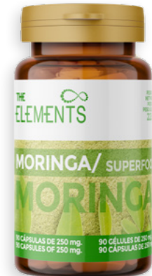
Moringa en càpsules Ref. 2629 - 6 x 90 p x 250g