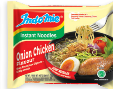
Noodles Pollastre amb Ceba Ref. 2393 - 40 x 75g