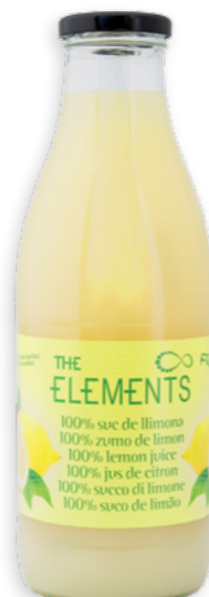
Suc de Llimona Ref. 2965 - 6 x 1l