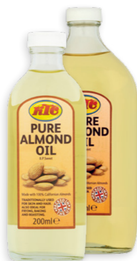
Oli d'Ametlles Ref. 2232 - 12 x 200ml Ref. 2829 - 12 x 500ml