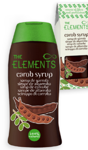
Xarop de garrofa The Elements Ref. 2966 - 6 x 320g