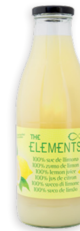
Suc de llimona The Elements Ref. 2965 - 6 x 1l

2663. Pasta de Gíngebre · Pasta de Jengibre · Ginger paste · Pâte de gingembre 2665. Pasta d'all · Pasta de ajo · Garlic paste · Pâte d'ail 2664. Pasta d'all i gíngebre · Pasta de ajo y jengibre · Ginger & Garlic paste · Pâte d'ail et gingembre 1919. Mostassa de Dijon a l'antiga · Mostaza de Dijon a la antigua · Wholegrain Dijon mustard · Moutarde de Dijon à l'ancienne 0162 & 1705. Mostassa de Dijon · Mostaza de Dijon · Dijon mustard · Moutarde de Dijon 1417 & 1377 & 3513. Salsa de pebrot picant · Salsa picante · Hot pepper sauce · Sauce au piment fort 2103 & 2086. Salsa de pebrot picant amb gíngebre · Salsa picante con jengibre · Hot pepper sauce with ginger · Sauce au piment fort au gingembre 2965. Suc de llimona · Zumo de limón · Lemon Juice · Jus de citron 1376 & 2365. Crema de sèsam torrat · Crema de sésamo tostado · Toasted Sesame cream · Crème de sésame grillé