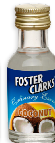
Essència de coco Ref.1484 - 12 x 28ml