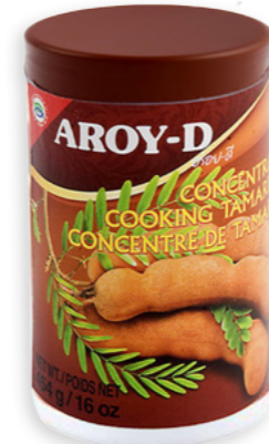
Concentrat de Tamarinde Ref. 1691 - 24 x 454g