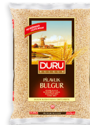
Bulgur Gros Clar Duru 1kg Ref. 2397 - 12 x 1kg