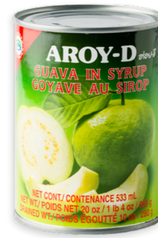
Guaiaba en almívar Ref. 0234 - 24 x 565g