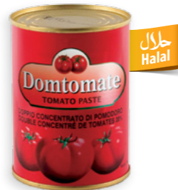
Domtomate 400g Ref. 0154 - 24 x 400g