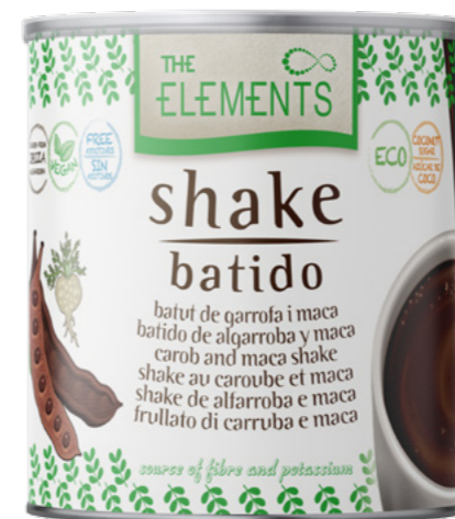
Batut de Garrofa i Maca Ref. 3290 - 6 x 400g