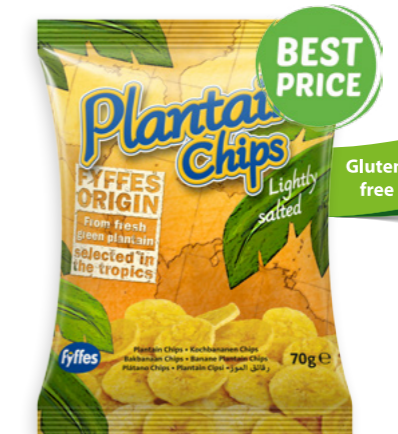
Xips de banana Fyffes salades Ref. 1778 - 24 x 70g