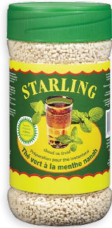
Te verd a la menta Ref. 2620 - 12 x 400g