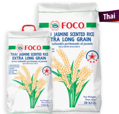
Foco Ref. 0298 - 1 × 5Kg Ref. 0297 - 1 × 20Kg