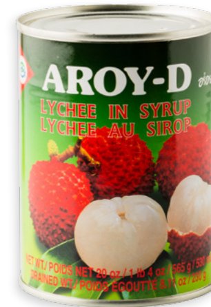
Litxi en almívar Ref. 0238 - 24 x 565g