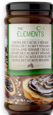
Crema de Sèsam i Cacao Ref. 3288 - 6 x 230g