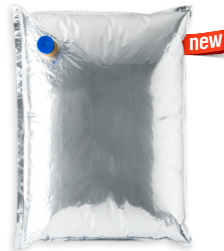
Crema de coco Ref. 3656 - 1 x 20l

2236 & 0197 & 0198 & 2824 & 3696 & 3744 & 0196. Llet de coco per cuinar · Leche de coco para cocinar · Coconut milk for cooking · Lait de noix de coco pour la cuisson 0199. Llet de coco per postres · Leche de coco para postres · Coconut milk for deserts · Lait de noix de coco pour le dessert 3656 & 0195 & 3695 & 0194. Crema de coco · Crema de coco · Coconut cream · Extrait de noix de coco