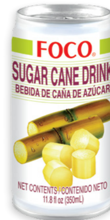
Canya de Sucre Ref. 0054 - 24 x 350ml