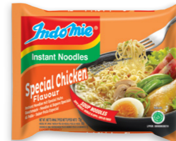
Noodles "Special Chicken" Ref. 0276 - 40 x 75g