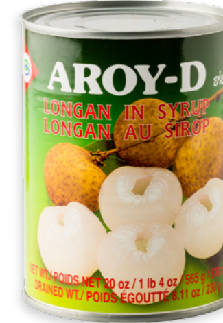
Longan en almívar Ref. 0237 - 24 x 565g