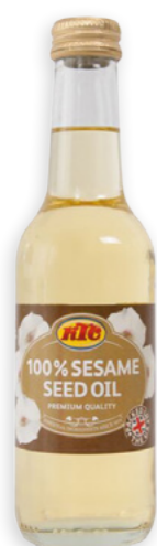
Oli de Llavors de Sèsam Cru Ref. 2230 - 12 x 250ml