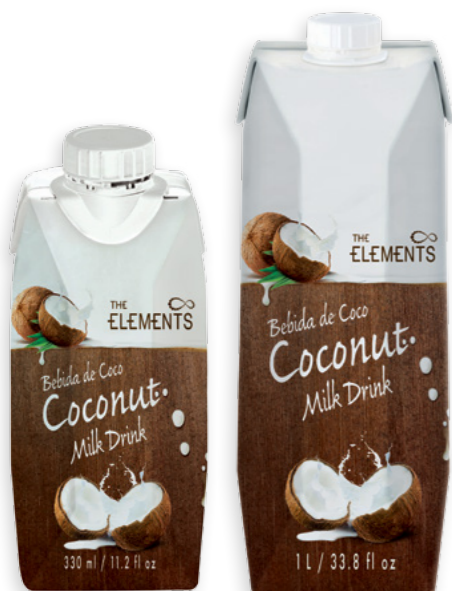
Beguda de Coco Ref. 2266 - 12 x 330ml / Ref. 2279 - 12 x 1l