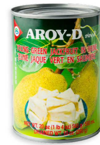
Green Jackfruit in brine Ref. 0236 - 24 x 565g