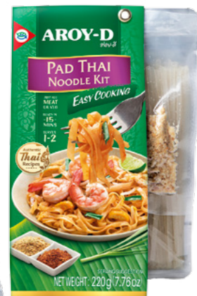
Ready to cook Noodle Kit Pad Thai Ref.3693 - 6 x 220g new