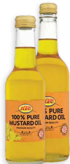
Oli de Mostassa Ref. 2231 - 12 x 250ml Ref. 2830 - 12 x 500ml