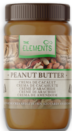
Pasta de Cacauet Ref. 2364 - 6 x 500g