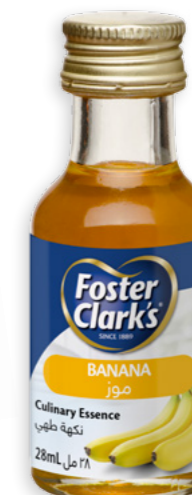
Essència de plàtan Ref.0121 - 12 x 28ml