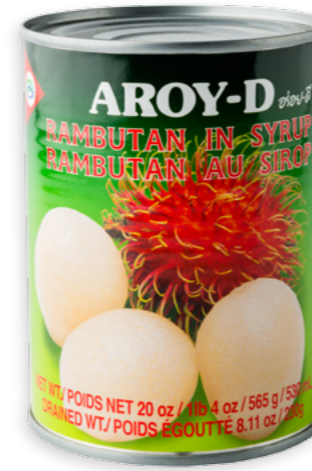
Rambutan en almívar Ref. 0242 - 24 x 565g