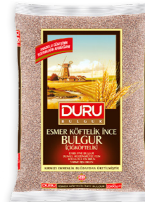
Bulgur Fi Fosc Duru 1kg Ref. 2400 - 12 x 1kg