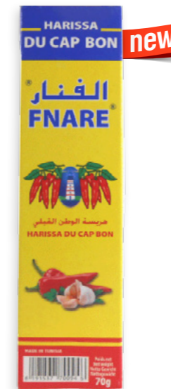
Salsa de Xili i All Harissa Ref. 3655 - 24 x 70g