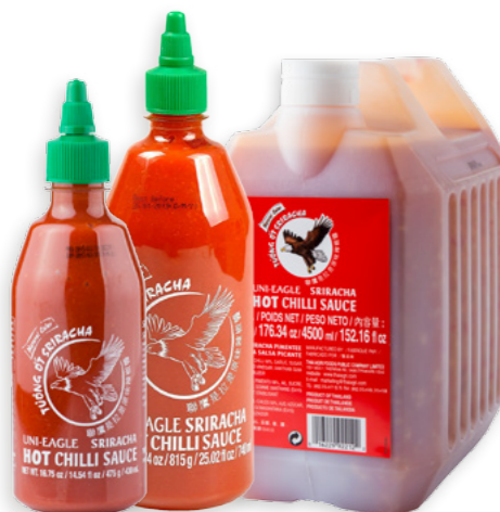
Salsa Xili Sriracha Uni-Eagle Ref. 0219 - 12 x 430ml Ref. 3287 - 12 x 740ml Ref. 3743 - 4 x 4500ml