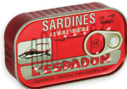
Sardines amb oli Espadon Ref. 0192 - 50 x 125g