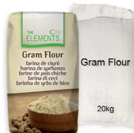
Farina de cigró The Elements Ref. 3330 - 12 x 1Kg / Ref. 3331 - 1 x 20Kg