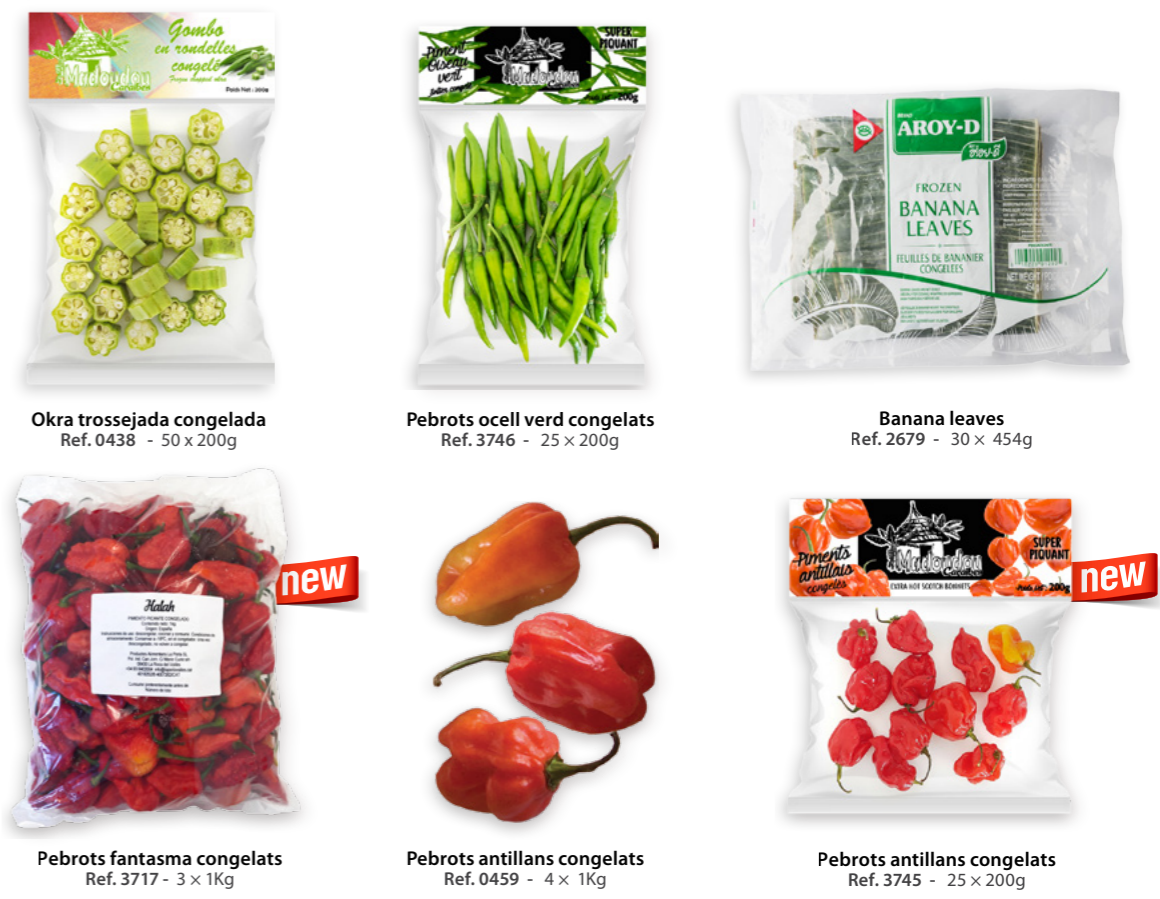
Okra trossejada congelada Ref. 0438 - 50 x 200g Pebrots ocell verd congelats Ref. 3746 - 25 x 200g Banana leaves Ref. 2679 - 30 x 454g Pebrots fantasma congelats Ref. 3717 - 3 x 1Kg Pebrots antillans congelats Ref. 0459 - 4 x 1Kg Pebrots antillans congelats Ref. 3745 - 25 x 200g