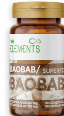
Baobab en càpsules Ref. 2654 - 6 x 90 p x 250g