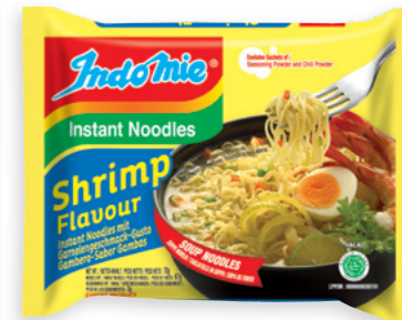
Noodles Gamba Ref. 0271 - 40 x 70g