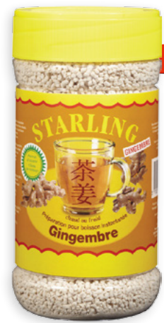
Te amb Gingebre Ref. 3680 - 12 x 400g