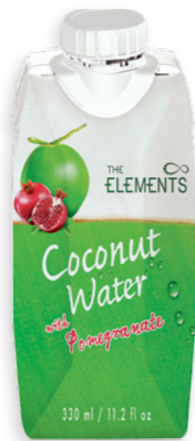
Aigua de Coco amb Magrana Ref. 2396 - 12 x 330ml