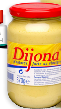
Mostassa Dijona Ref. 0162 - 12 x 370g Ref. 1705 - 6 x 1065g