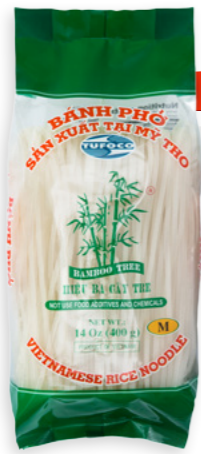
Tallarines 3mm Bamboo Tree Ref. 3735 - 30 x 400g