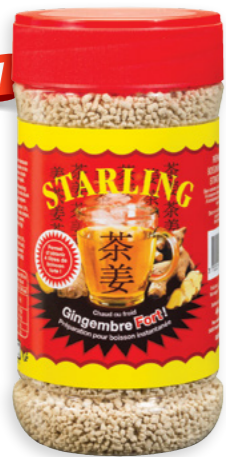
Te amb Gingembre HOT Ref. 2621 - 12 x 400g