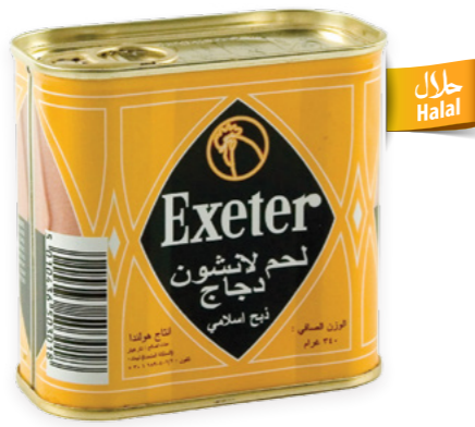
Exeter de pollastre Ref. 0178 - 24 x 340g