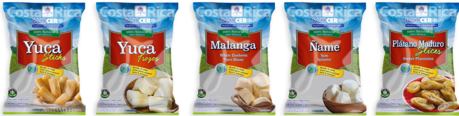
Yuca Sticks Ref. 2686 - 12 x 1Kg Trossos de Yuca Ref. 2687 - 12 x 1Kg Trossos de Malanga Ref. 2688 - 12 x 1kg Trossos de Nyam Ref. 2689 - 12 x 1Kg Sweet Plantains Ref. 2690 - 12 x 1Kg