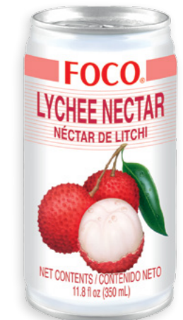
Litxi Ref. 0059 - 24 x 350ml

Sucs de fruita · Zumos de fruta Fruit juices · Jus de fruits