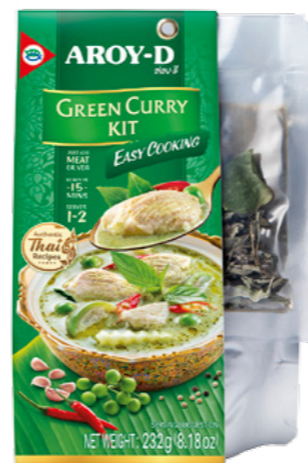
Ready to cook Kit Curri Verd Ref.3689 - 6 x 232g new