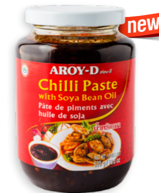
Pasta de Xili amb oli de soja Ref. 0206 - 24 x 520g