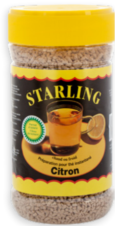
Te amb llimona Ref. 2144 - 12 x 400g