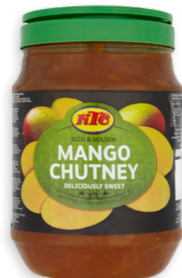
Chutney de Mango dolç Ref. 1680 - 2 x 2,6kg