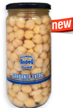
Cigrons Cuits Extra Ref. 3782 - 6 x 700g new