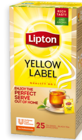
Te Lipton Yellow label Ref. 1493 - 6 x 25 bags