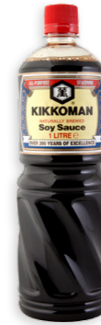
Salsa de soja Kikkoman 1l Ref. 1175 - 6 x 1l