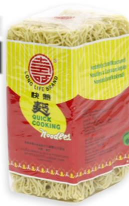
Noodles Chinese Style Long Life Ref. 2205 - 30 x 500g