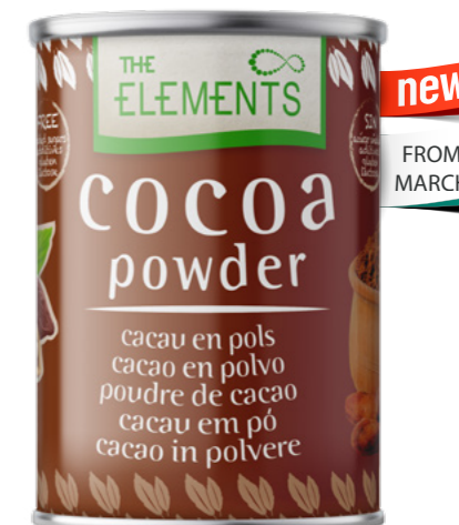
Cacau en pols Ref. 3824 - 12 x 250g