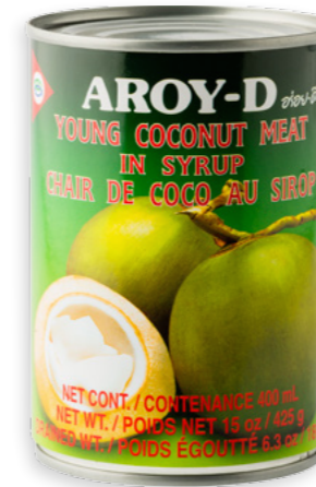
Carn de coco en almívar Ref. 2453 - 24 x 425g