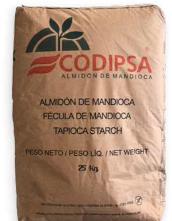
Midó de iuca dolç Ref. 1617 - 1 x 25kg