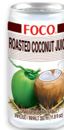
Coco torrat Ref. 0066 - 24 x 350ml