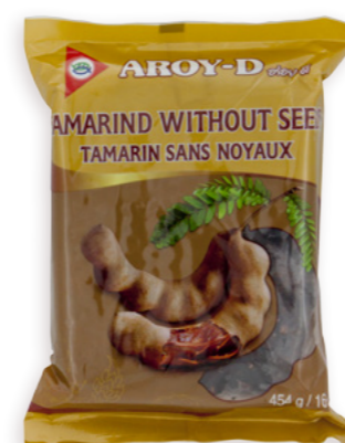
Pasta de Tamarinde Ref. 0189 - 24 x 454g