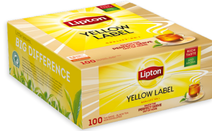
Te Lipton Yellow label Ref. 2249 - 12 x 100 units

2144. Te amb llimona · Té con limón · Tea with lemon · Thé au citron 2620. Te verd amb menta · Té verde con menta · Green Tea with mint · Thé vert à la menthe 3684. Te amb poma · Té con manzana · Tea with apple · Thé au pomme 3681. Te amb fruites del bosc · Té con frutos del bosque · Tea with berries · Thé au fruits sauvages 3682. Te amb mango · Té con mango · Tea with mango · Thé au mangue 3680. Te amb gingebre · Té con jengibre · Ginger tea · Thé avec gingembre 2621. Te amb gingebre picant · Té con jengibre picante · Hot ginger tea · Thé avec gingembre épicé 2623. Te amb gingebre, mel i llimona · Té con jengibre, miel y limón · Tea with ginger, honey and lemon · Thé avec miel, gingembre et citron 3210. Te amb Gingebre i bissap · Té con jengibre y bissap · Ginger and bissap tea · Thé avec gingembre et bissap 3679. Te amb bissap · Té con bissap · Bissap tea · Thé avec bissap 3683. Te amb Baobab · Té con Baobab · Baobab tea · Thé avec Baobab 2622. Te amb Tamarinde · Té con tamarindo · Tamarind tea · Thé avec tamarin 3686. Te amb Préssec · Té con Melocotón · Peach tea · Thé avec Pêche