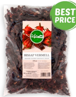
Bissap vermell Safna Ref. 1967 - 10 x 250g

2249 & 1493. Te negre · Té negro · Black tea · Thé noir 2161. Te amb fruits del bosc · Té con frutas del bosque · Forest fruits tea · Thé fruits rouges 1915. Te negre "Earl Grey" · Té negro "Earl Grey" · "Earl grey" black tea · Thé noir "Earl grey" 1914. Te negre "English Breakfast" · Té negro "English Breakfast" · "English Breakfast" black tea · Thé noir "English breakfast" 2162. Te verd · Té verde · Green tea · Thé vert 1967 & 1438 & 0101. Hibisc vermell (bissap) · Hibisco rojo (bissap) · Red Bissap · Bissap rouge (Carcadé) 1968 & 1437 & 0099. Hibisc blanc (bissap) · Hibisco blanco (bissap) · White bissap · Bissap blanc (Carcadé) 1969 & 1439. Fulles de kinkeliba · Hojas de kinkeliba · Kinkeliba leaves · Feuilles de kinkeliba