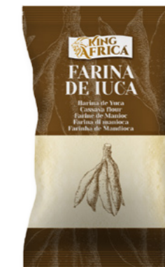
Farina de iuca Ref. 0351 - 12 x 700g