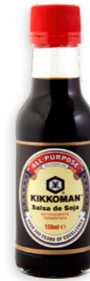
Salsa de soja Kikkoman 150ml Ref. 1921 - 12 x 150ml