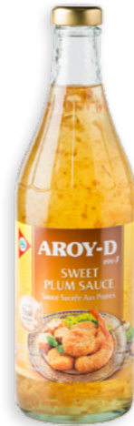
Salsa de Pruna dolça Aroy-D Ref. 3089 - 12 x 740ml