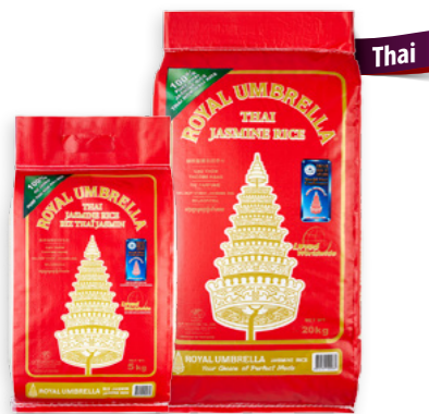
Royal Umbrella Ref. 0302 - 5 × 5Kg Ref. 0301 - 1 × 20Kg