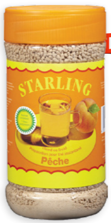
Te amb Préssec Ref. 3686 - 12 x 400g

2144. Te amb llimona · Té con limón · Tea with lemon · Thé au citron 2620. Te verd amb menta · Té verde con menta · Green Tea with mint · Thé vert à la menthe 3684. Te amb poma · Té con manzana · Tea with apple · Thé au pomme 3681. Te amb fruites del bosc · Té con frutos del bosque · Tea with berries · Thé au fruits sauvages 3682. Te amb mango · Té con mango · Tea with mango · Thé au mangue 3680. Te amb gingebre · Té con jengibre · Ginger tea · Thé avec gingembre 2621. Te amb gingebre picant · Té con jengibre picante · Hot ginger tea · Thé avec gingembre épicé 2623. Te amb gingebre, mel i llimona · Té con jengibre, miel y limón · Tea with ginger, honey and lemon · Thé avec miel, gingembre et citron 3210. Te amb Gingebre i bissap · Té con jengibre y bissap · Ginger and bissap tea · Thé avec gingembre et bissap 3679. Te amb bissap · Té con bissap · Bissap tea · Thé avec bissap 3683. Te amb Baobab · Té con Baobab · Baobab tea · Thé avec Baobab 2622. Te amb Tamarinde · Té con tamarindo · Tamarind tea · Thé avec tamarin 3686. Te amb Préssec · Té con Melocotón · Peach tea · Thé avec Pêche