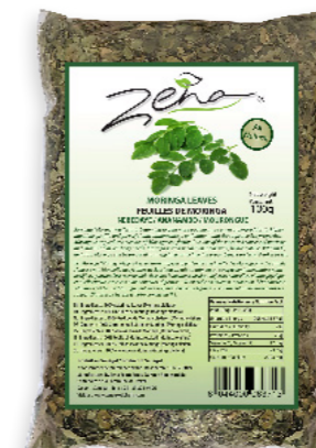
Fulles de Moringa Ref. 2630 - 15 x 100g

0094. Gingebre · Jengibre · Ginger · Gingembre 1887. Gingebre sense sucre · Jengibre sin azúcar · Ginger without sugar · Gingembre sans sucre 2084. Lima · Lima · Lime 2082. Menta · Menta · Mint · Menthe 2085. Magrana · Granada · Pomegranate · Grenade 0093. Bissap · Bissap · Bissap · Bissap (Karkadé) 0096. Tamarinde · Tamarindo · Tamarind · Tamarin 3270. Bissap i gingebre · Bissap y jengibre · Bissap and ginger · Bissap et gingembre 0110. Yerba mate · Yerba mate · Yerba mate · Yerba mate 1435 & 1888. Llavors de l'arbre de baobab · Semillas del árbol de baobab · Baobab tree seeds · Graines de baobab 1986. Moringa en pols · Moringa en polvo · Powdered Moringa · Moringa en poudre 1436. Llavors de l'arbre de baobab en pols · Semillas del árbol de baobab molidas · Baobab tree seeds powdered · Poudre de graines de baobab 2630. Fulles de Moringa · Hojas de Moringa · Moringa leaves · Feuilles de Moringa