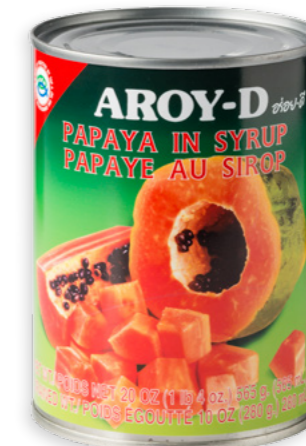
Papaia en almívar Ref. 0240 - 24 x 565g