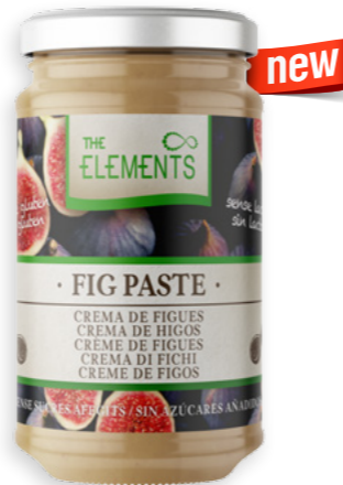
Crema de figues Ref. 3740 - 6 x 450g