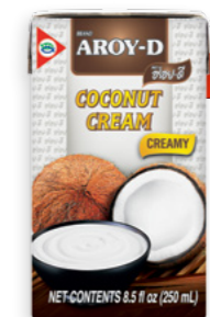
Crema de coco Ref. 3695 - 36 x 250ml