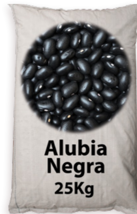
Mongeta Negra Ref. 3779 - 1 x 25Kg new