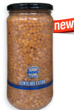
Llenties Cuits Extra Ref. 3781 - 6 x 660g new