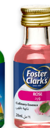
Essència de rosa Ref.2007 - 12 x 28ml