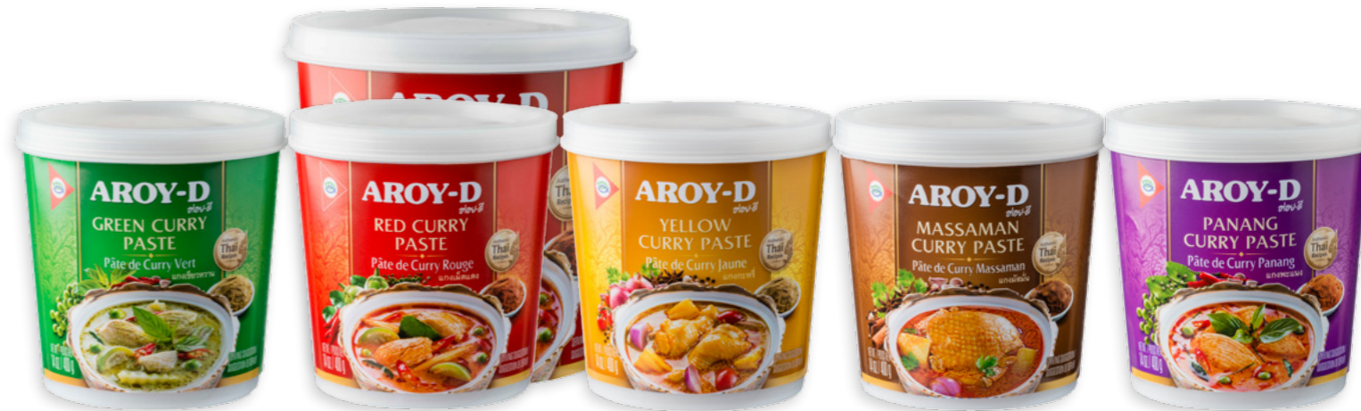
Pasta de curri verd Ref. 0204 - 24 x 400g

2299. Oli de coco verge · Aceite de coco virgen · Virgin Coconut oil · Huile de coco vierge 2297 & 2466. Oli de coco pur · Aceite de coco puro · Pure Coconut oil · Huile de coco pur 3377. Oli d'arròs · Aceite de arroz · Rice Oil · Huile de riz 2918. Oli de llavors de sèsam torrat · Aceite de semillas de sésamo tostado · Toasted Sesam Seed Oil · Huile de graines de sésame grillé 2230. Oli de llavors de sèsam cru · Aceite de semillas de sésamo crudo · Raw Pure Sesam Seed Oil · Huile de graines de sésame cru 2231 & 2830. Oli de mostassa · Aceite de mostaza · Pure Mustard Oil · Huile de moutarde 2252. Oli de llavors de Llinosa · Aceite de linazada · Linseed Oil · Huile de lin 2829 & 2232. Oli d'ametlles · Aceite de almendras · Pure Almond Oil · Huile de amandes 3667 & 1680. Chutney o mermelada de Mango dolç · Chutney o mermelada de mango dulce · Sweet Mango chutney or Mango jam · Chutney ou confiture de mangue douce 1690. Polpa de Mango Kesar · Pulpa de Mango Kesar · Kesar Mango Pulp · Pâte de mangue Kesar 2844. Tamarinde pur premsat i assecat amb llavor · Tamarindo puro prensado y secado con semilla · Pressed and dried pure tamarinde with seed · Tamarinde pur pressé et séché avec noyaux