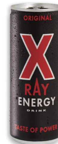
X. Ray Ref. 0048 - 24 x 250ml

REFRESCS REFRESCOS SOFT DRINKS RAFRAÏCHISSANTES