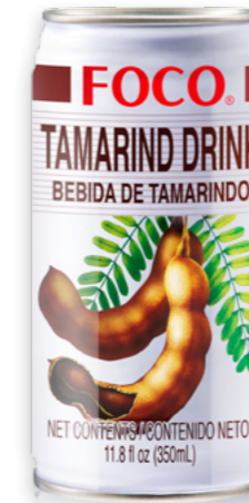
Tamarinde Ref. 0067 - 24 x 350ml