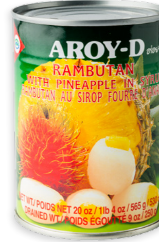
Rambutan amb pinya en almívar Ref. 0241 - 24 x 565g