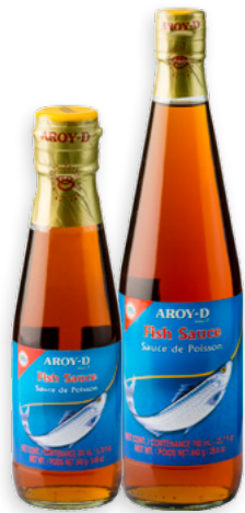
Salsa de peix Aroy-D Ref. 2667 - 24 x 200ml Ref. 3329 - 12 x 700ml