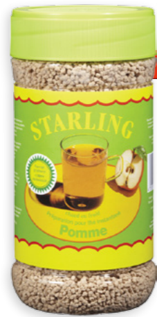
Te amb Poma Ref. 3684 - 12 x 400g