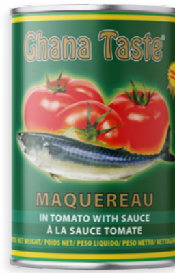
Verat amb tomàquet Ghana Taste Ref. 0187 - 24 x 425g